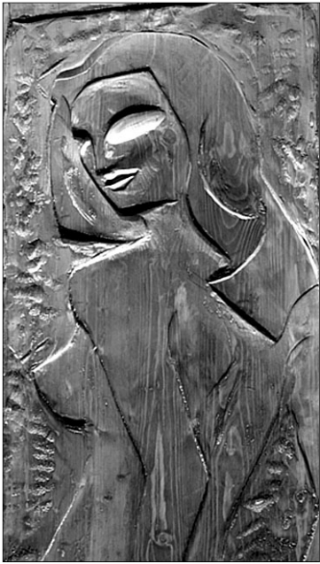
Bajorrelieves en distintas maderas.