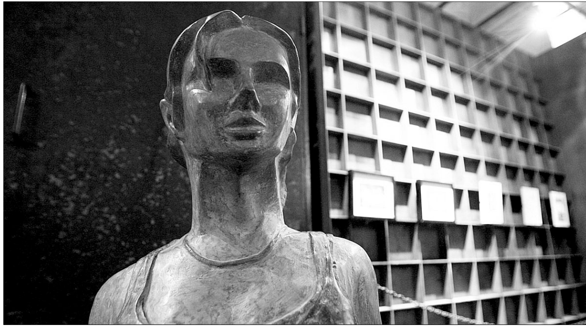
Gran variedad de técnicas y estilos al servicio de una sola temática: el universo de la mujer.