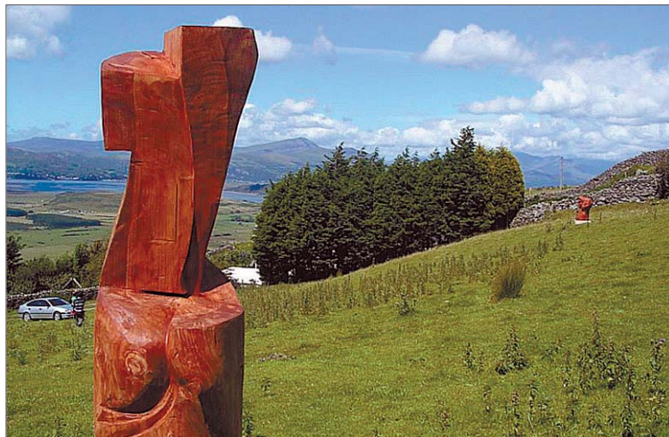
Las piezas de Giordano permanecen expuestas en un entorno privilegiado. //G

La presencia de artistas de diferentes nacionalidades en las cuatro ediciones de NEXO celebradas hasta el momento y la participación de creadores del ámbito toledano en eventos europeos como la recientemente finalizada Bienal de Harlech (Gales) ha permitido ir concretando un proyecto que será presentado de forma oficial a lo largo de las próximas semanas y al que irán sumándose encuentros parecidos de países como Bulgaria y Macedonia -además de Gales-, cuya entrada en el proyecto podría hacerse efectiva a partir de 2008. Por el momento, representantes de esos países, junto con artistas procedentes de Italia e Israel, entre otras nacionalidades, se darán cita