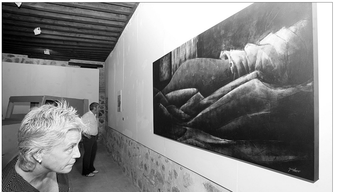
El Centro Cultural San Clemente y el Círculo de Arte acogen una muestra dividida.