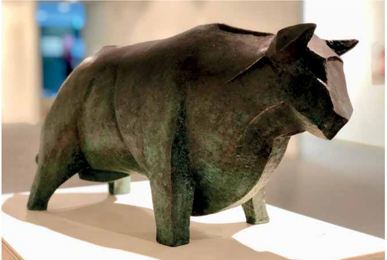
Toro Astur (2018). Bronze. 50 x 16 x 25 cm.