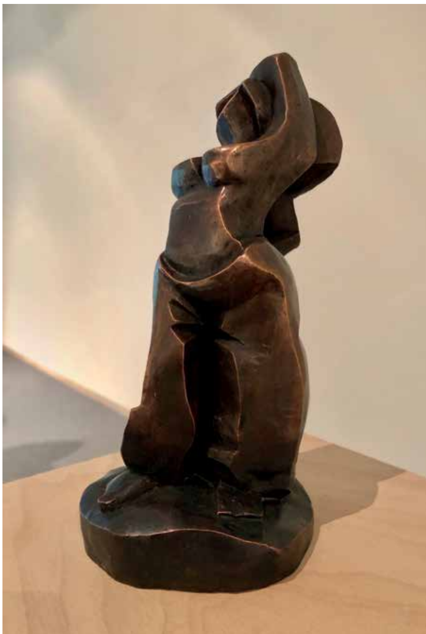
La Bailarina (2018). Bronce. 15 x 17 x 35 cm.