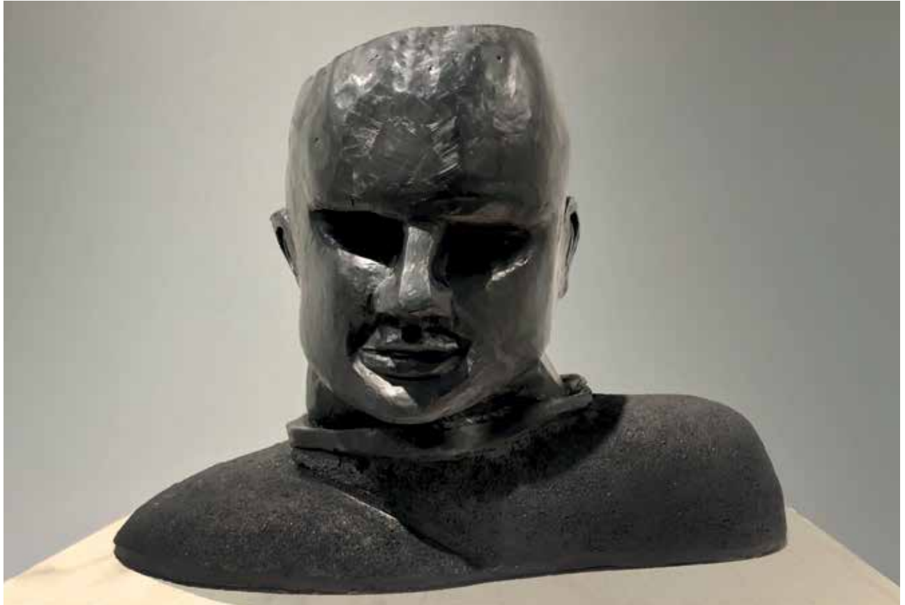
Cortázar (2018). Búcaro negro y sonido (cuentos de Julio Cortázar narrados por él mismo). 40 x 30 x 35 cm.