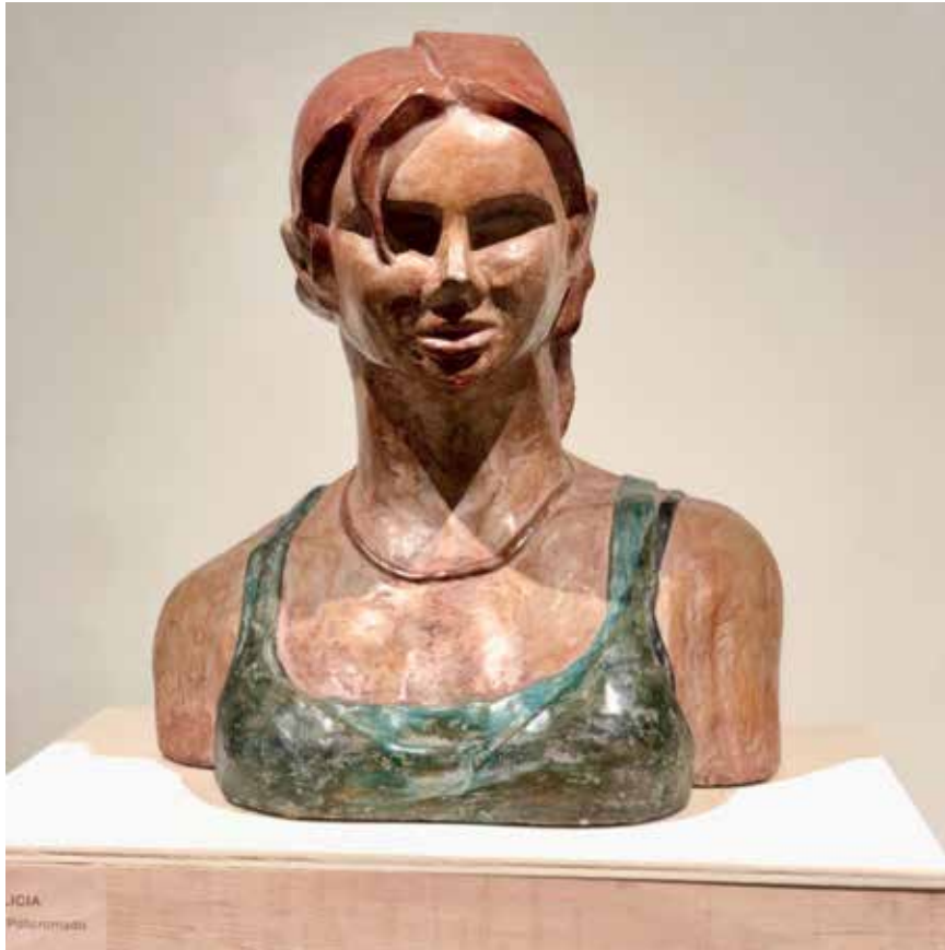
Alicia (1995). Cemento policromado. 37 x 28 x 40 cm.