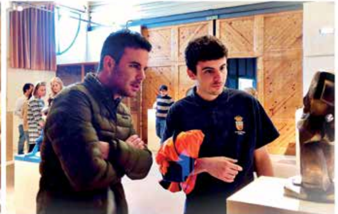
Inauguración en el Museo de la Sidra de Asturias