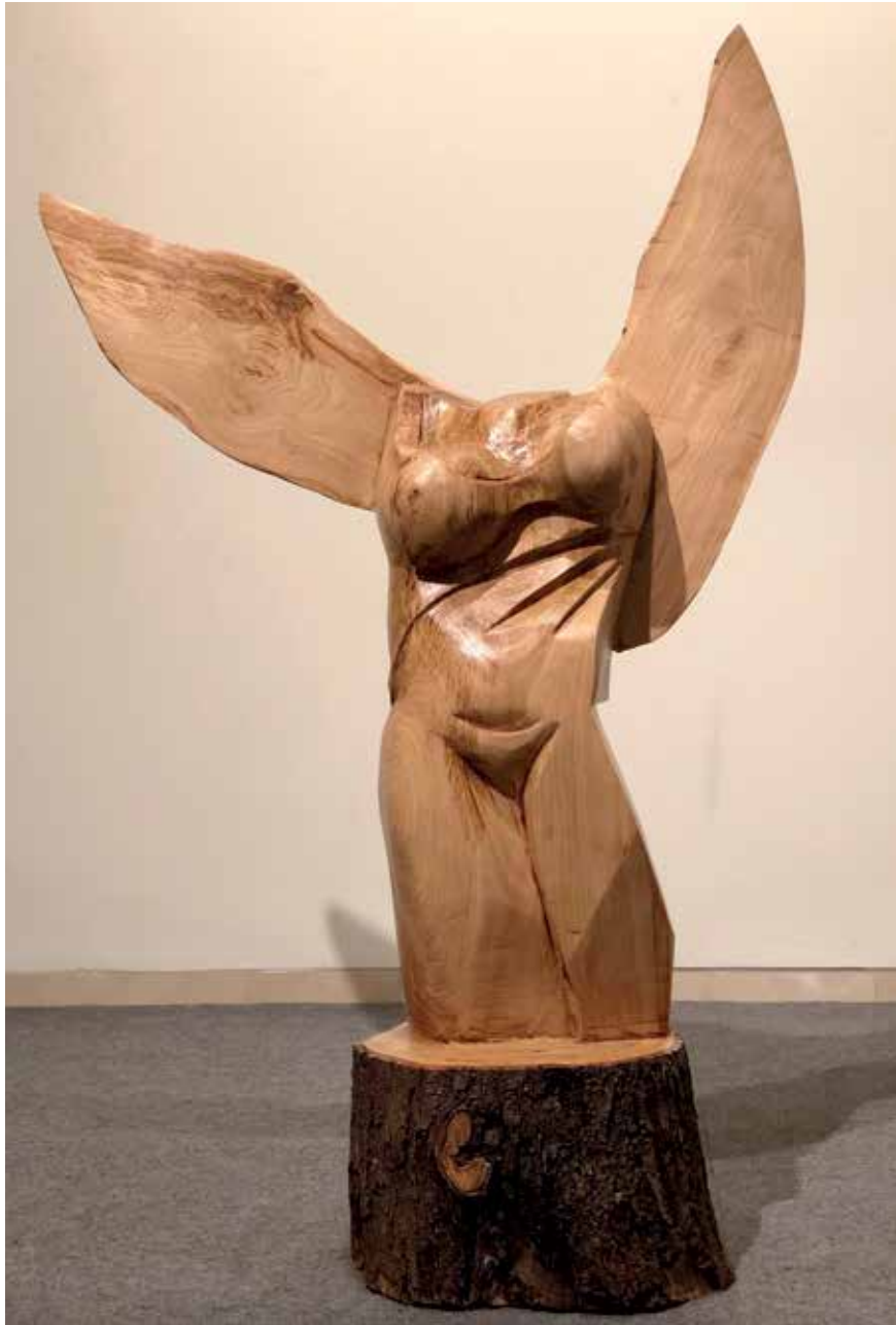
La hija de Ícaro (2019). Roble. 105 x 45 x 160 cm.