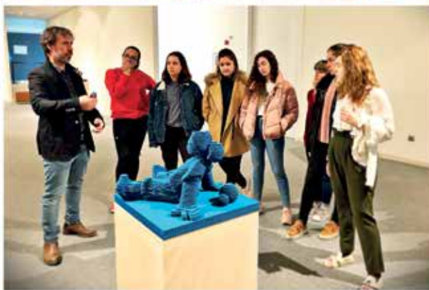
Visita de alumnas de Historia del Arte de 2º de Bachillerato del IES Río Nora.