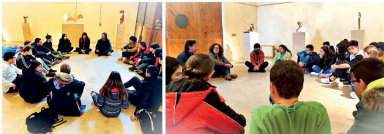
Visita de alumnos de Educación Plástica de 3º y 4º año de la ESO del IES Peñamayor.