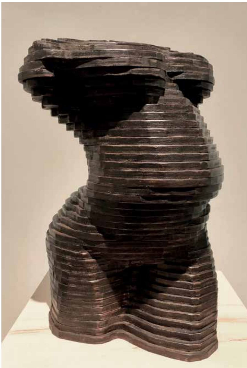
Torso (2019). Madera laminada. 30 x 20 x 43 cm.