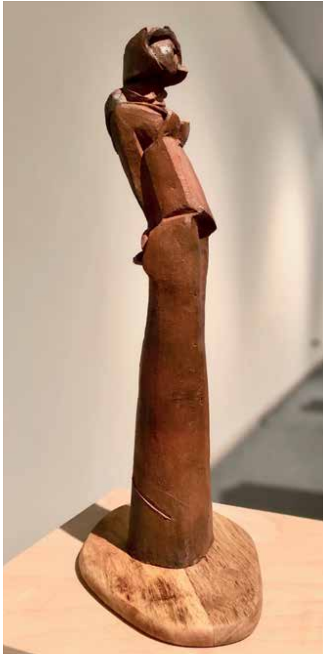
Laura (2014). Raku vilanoviano. 10 x 9 x 54 cm.