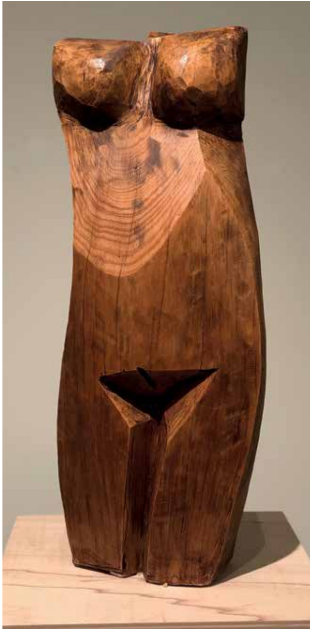
Mulier Lignea I (2008). Pino. 25 x 20 x 60 cm.