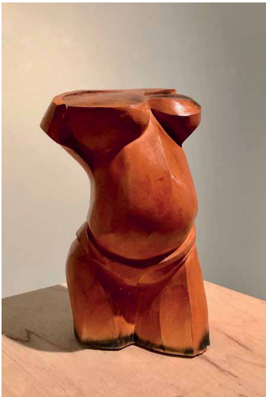
Torso (2012). Raku vilanoviano. 18 x 16 x 25 cm.