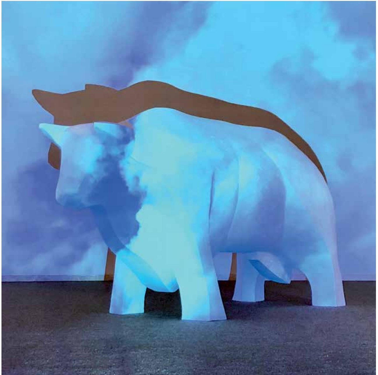
Toro Astur (2019). Resina y videoinstalación (nubes sobre las montañas de Asturias). 260 x 100 x 130 cm.