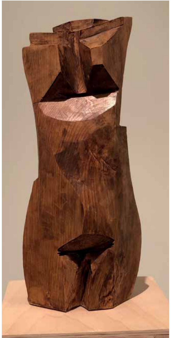
Mulier Lignea II (2008). Pino. 25 x 20 x 60 cm.