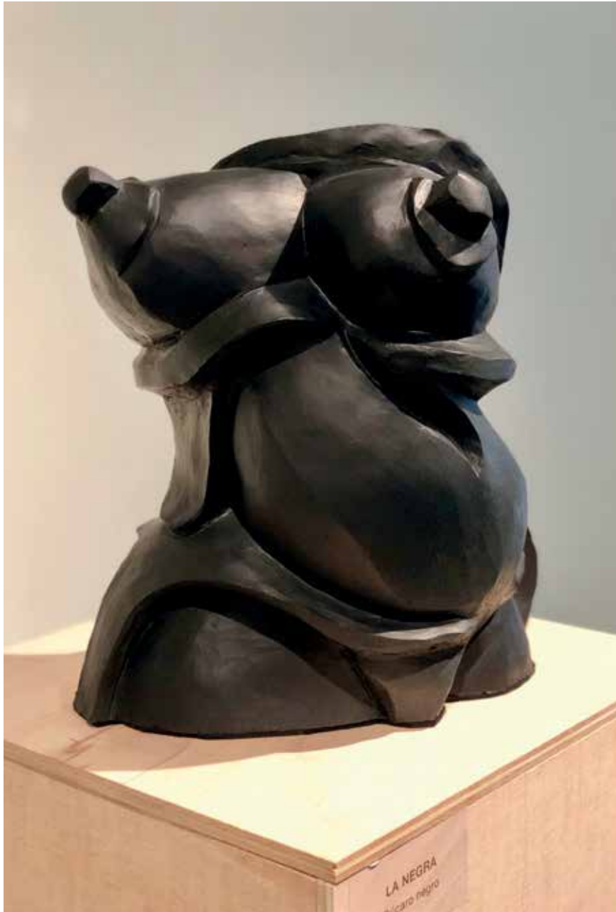
La negra (2015). Búcaro negro y sonido (música clásica). 30 x 25 x 30 cm.