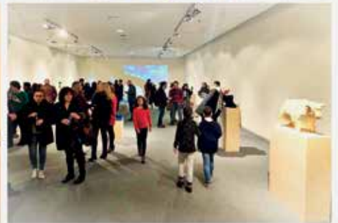
Inauguración en la Casa de Cultura La Pola Siero