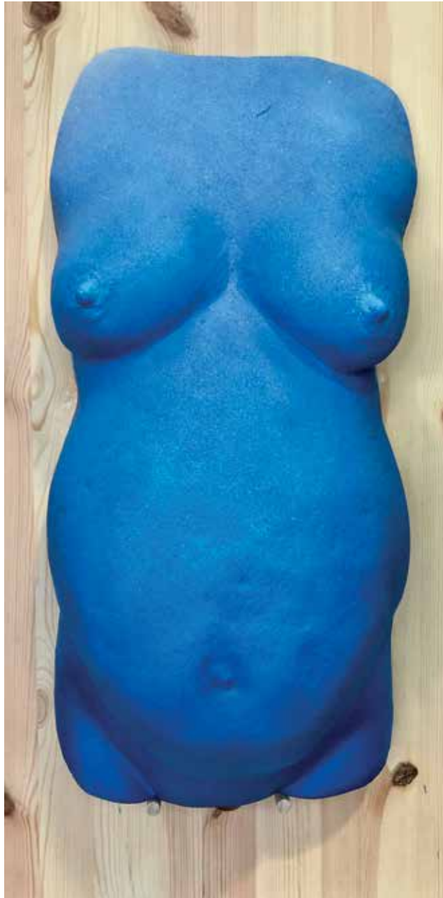
Germinal (2019). Sulfato de calcio y sonido (latido fetal). 30 x 20 x 60 cm.