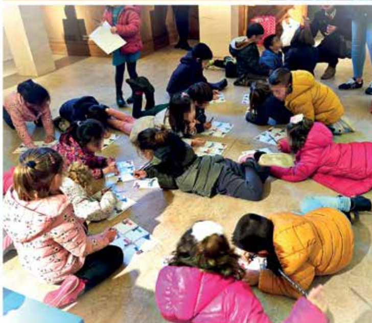
Visita de alumnos de 3° de Infantil del Colegio Público San Bartolomé.