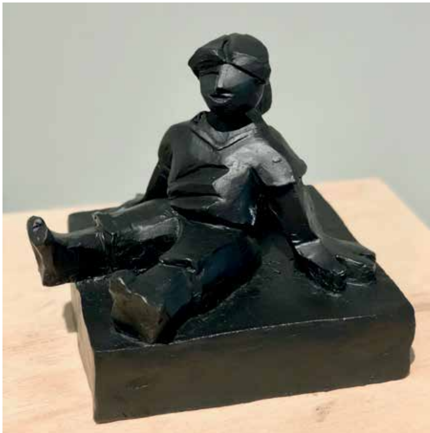
Final de juego (2015). Búcaro negro. 17 x 19 x 17 cm.