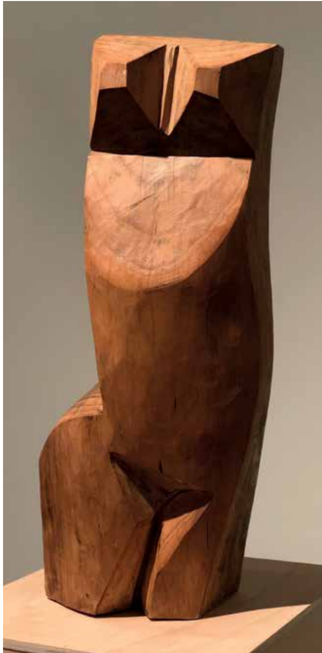
Mulier Ligna III (2008). Pino. 25 x 20 x 60 cm.