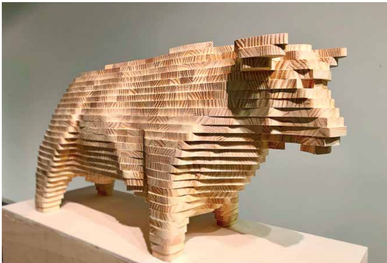
Toro Castizo (2019). Madera laminada. 90 x 25 x 47 cm.