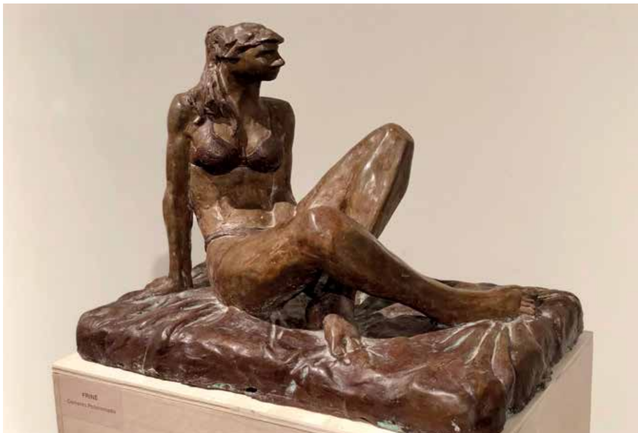
Friné (1997). Cemento policromado. 50 x 31 x 36 cm.