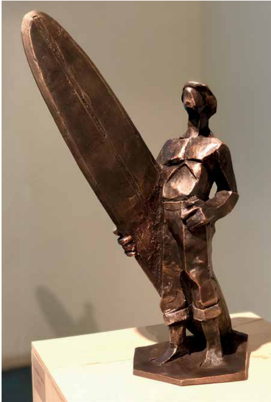
La primera tabla (2018). Bronce. 25 x 15 x 50 cm.