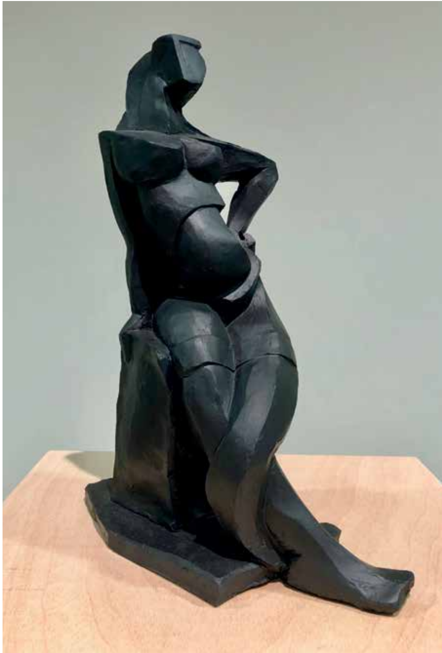
La Fresca de Cogorderos (2015). Búcaro negro. 23 x 15 x 34 cm.