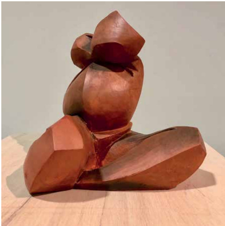
Sentada (2013). Raku vilanoviano. 20 x 20 x 20 cm.