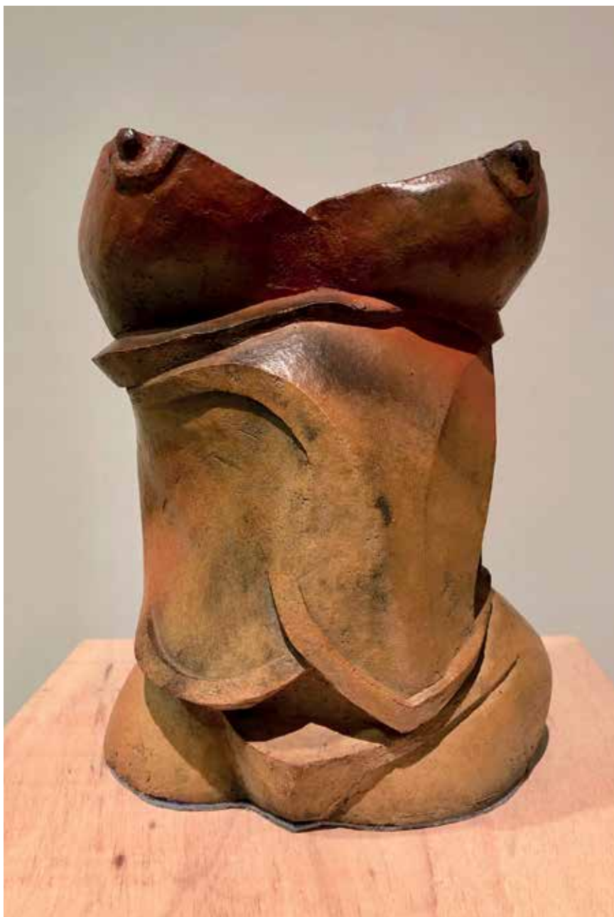
Corset (2014). Raku vilanoviano y sonido (Lluvia en un bosque asturiano). 25 x 20 x 30 cm.